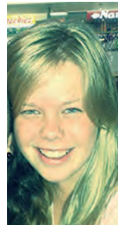
Illustrasies Danelle van den Berg