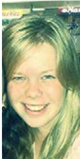
Illustrasies Danelle van den Berg