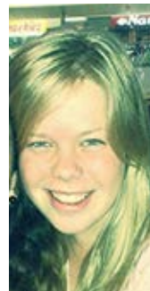
Illustrasies Danelle van den Berg